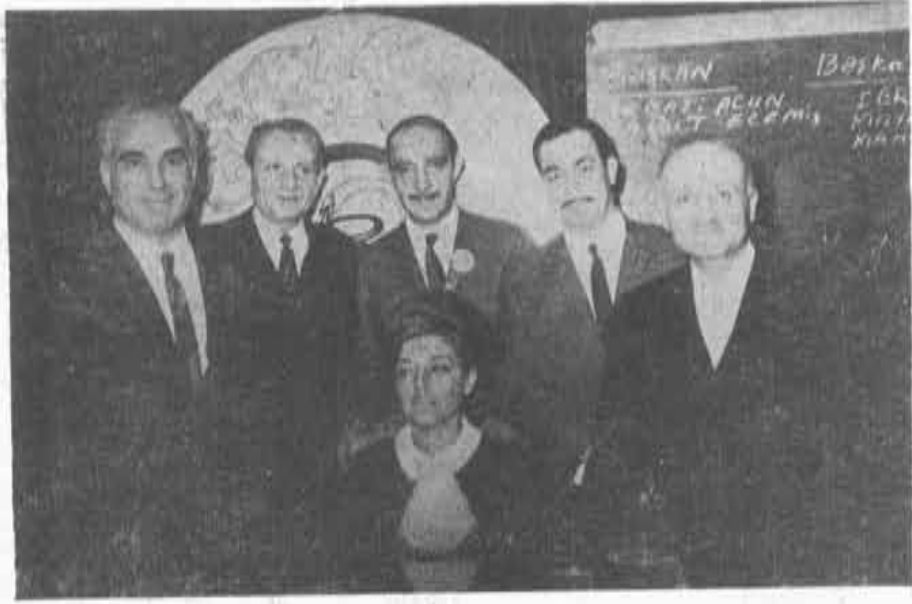
• Üçüncü Bölge İzmir Eczacı Odası Büyük Kongre delegeleri