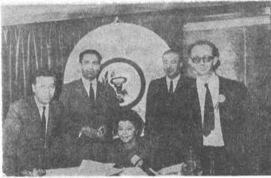
Dokuzuncu Bölge Eskişehir Eczacı Odası Büyük Kongre delegeleri