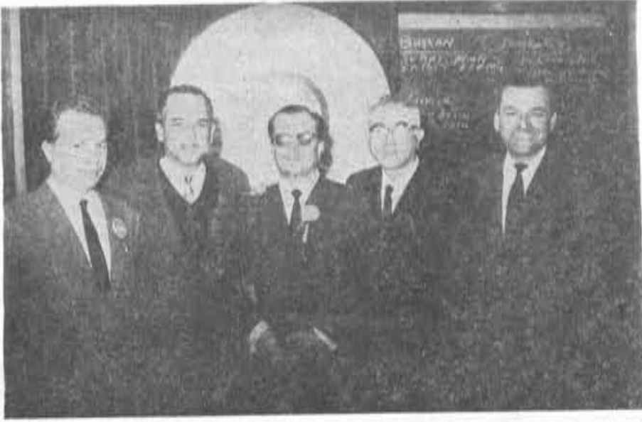
Yedinci Bölge Bursa Eczacı Odası Büyük Kongre delegeleri

kez Heyeti üyelerinin verdiği bilgiye dayanarak ve Fiat beyannameleri tetkik işinin birlikten alınmasını düşünerek 1 eczacı uzman kadrosu getirdik. Burada ikinci eczacı lazım diyorlar. İhtiyaç var ise 1 kadro daha konulacaktır. Yolluk ve yevmiyelere gelince Yüksek Haysiyet Divanının 6 ayda bir toplanması lazımdır. 1 veya iki gün sürerse düşüncesiyle arttırılmıştır. Artarsa başka fasllara aktarma yapılabilir.