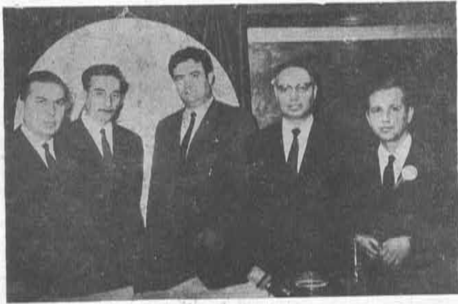
Beşinci Bölge Konya Eczacı Odası Büyük Kongre delegeleri