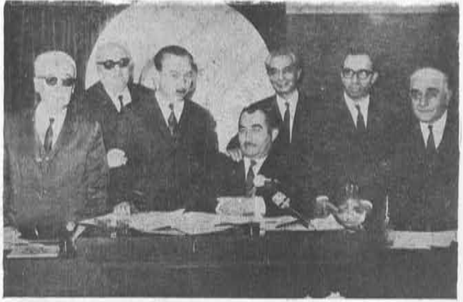
İkinci Bölge Ankara Eczacı Odası Büyük Kongre delegeleri