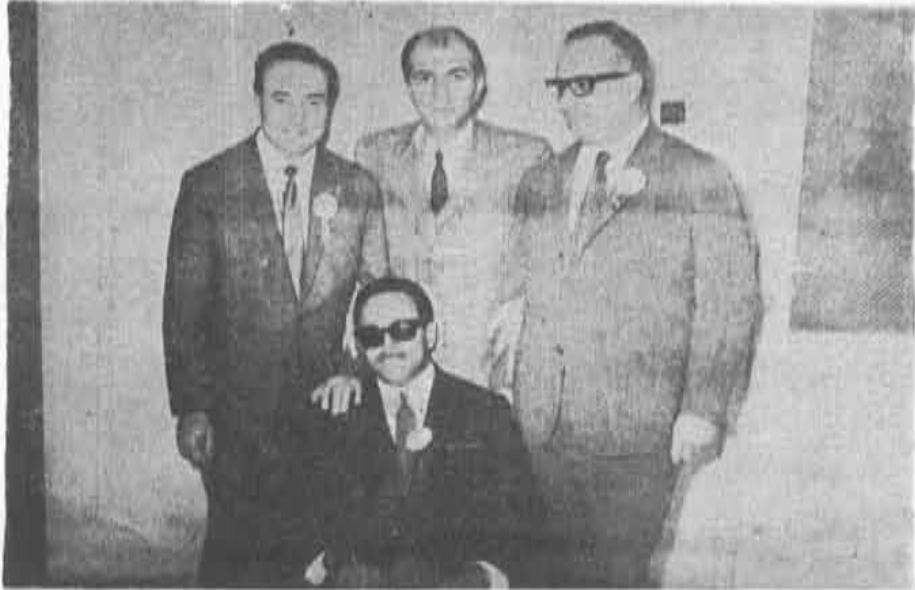
Altıncı Bölge Samsun Eczacı Odası Büyük Kongre delegeleri