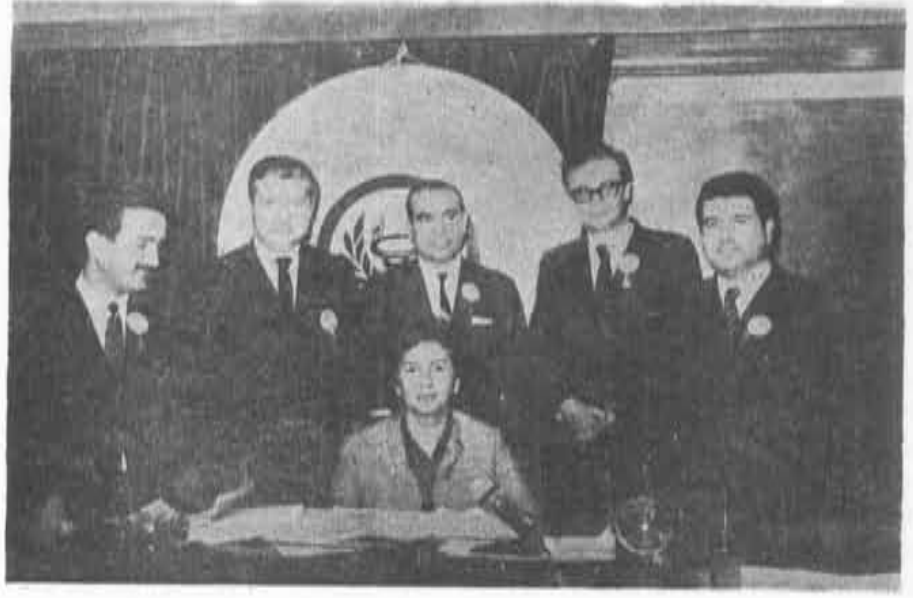
Birinci Bölge İstanbul Eczacı Odası Büyük Kongre delegeleri