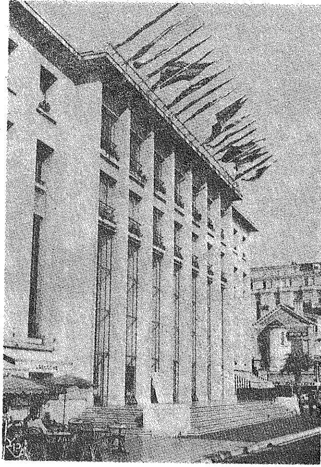
314 AU SOLEIL DE LA COTE D'AZUR, CANNES - Palais des Festivals