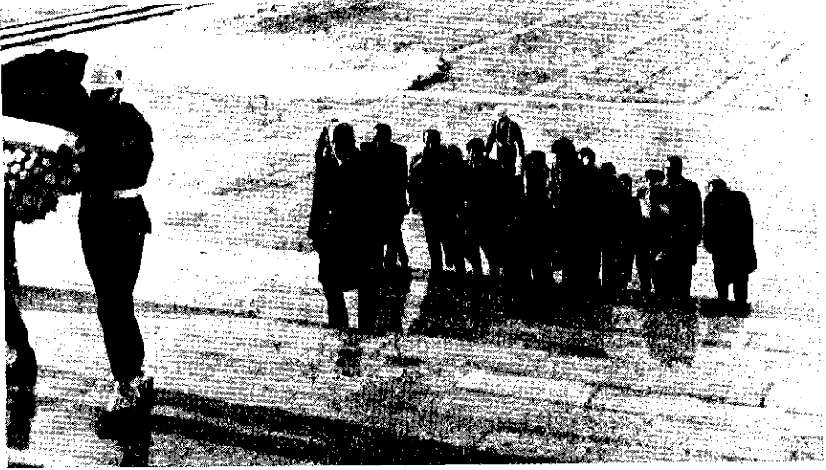
Ant Kabir'i ziyaret.