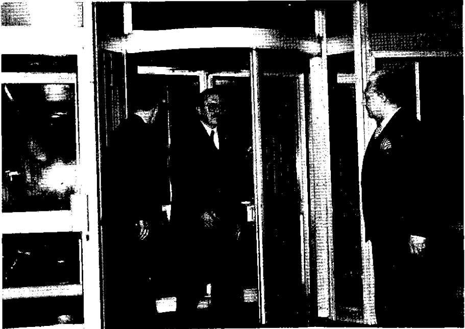
Sağlık Bakanı Bülent Akarcalı'yı karşılama.