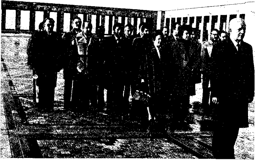
Büyük Ata'ya saygı duruşu.