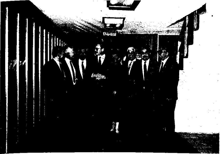
Sağlık Bakanı Bülent Akarcalı'yı Uğurlama