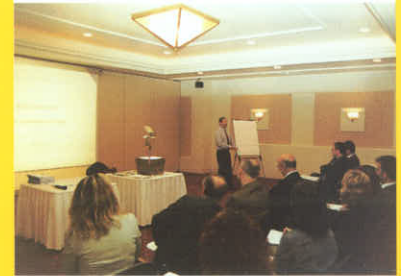
Eczane İşletmeciliği Eğitimi/Trabzon