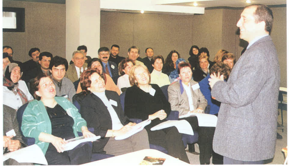
Eczane İşletmeciliği Eğitimi/Kayseri