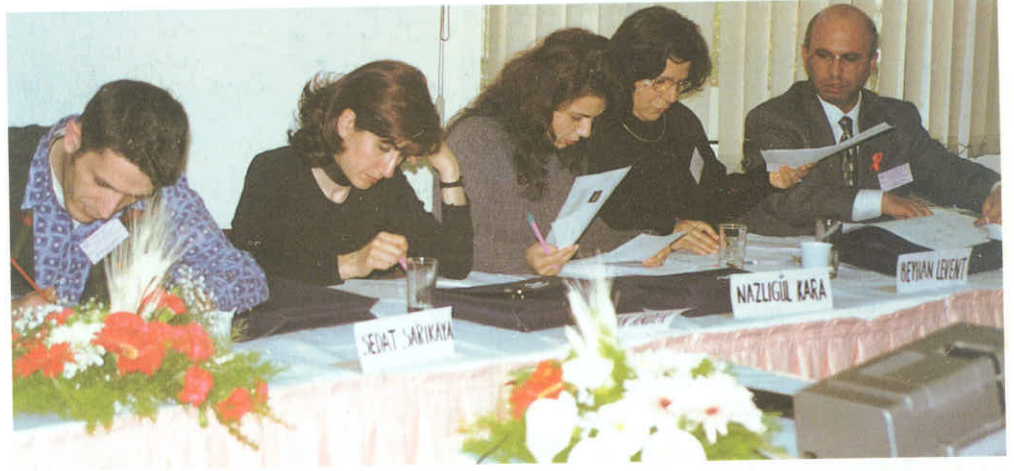
II. HIV/AIDS Eğitimi/Ankara

31. Olağan Büyük Kongre'de lisans sonrası eğitimin düzenlenmesi ve koordinasyonu için Eczacılık Akademisi kararı alınmıştı.