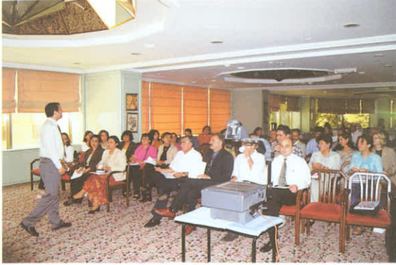
Eczane İşletmeciliği Eğitimi/Adana

Ülkemizde ekonomik krizler sık sık yaşanıyor. Bu ortamda eczacıların eczane işletmeciliğine yönelik sürekli stratejik değişiklikler yapması gerekiyor. Eczane eczacısı meslektaşlarımızın daha fazla işletmecilik bilgisi edinmesi, gündelik bir ihtiyaç.