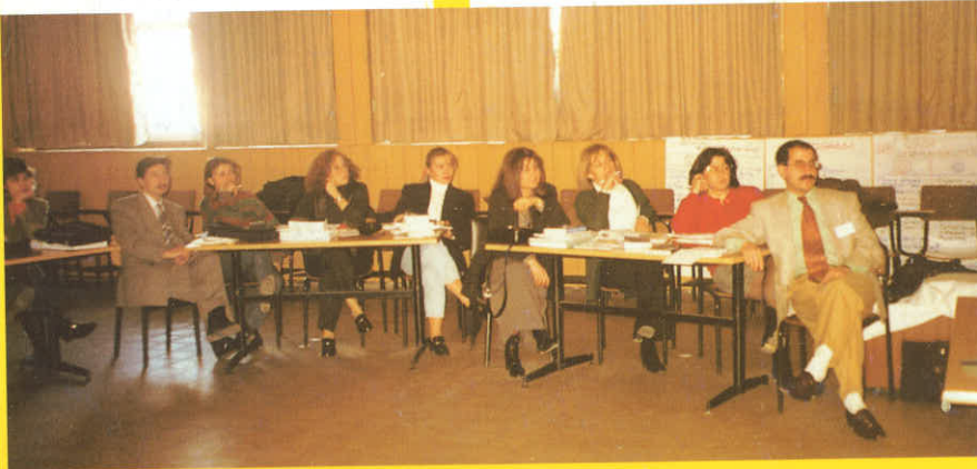
I. Aile Planlaması Eğitimi/İstanbul

Tesis'in içinde bulunan, altı dersliğe bölünen, ayrıca bir kütüphanesi ve bir de öğretim üyelerinin çalışma mekanı bulunan bir alanda hizmet verecek. Bu akademi binasında; mesleki eğitimler, lisans sonrası ihtiyaç duyulan alanlardaki eğitimler yapılacak, ayrıca eczanelerde çalışan, bugün kalfa dediğimiz, bizim eczane teknisyeni yapmak istediğimiz kişiler burada eğitilecek.