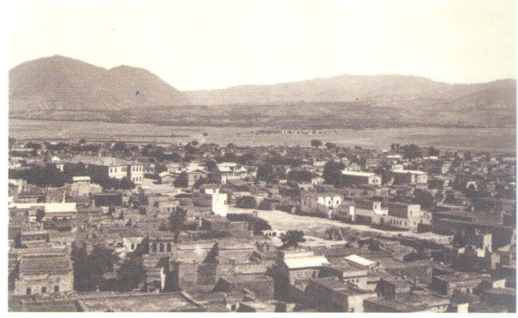
1930'lu yılların başında Kayseri

Bağımsız sancak iken 1924 Anayasası ile vilayet yapılan Kayseri, Cumhuriyet'in ilk yıllarında 39.500 nüfuslu, harap küçülmüş ve fakirleşmiş bir şehir halinde idi. Cumhuriyetle birlikte şehirde ticari ve sanayi kalkınma hamleleri başlamış, 1927'de demiryolu hattının Ankara'ya bağlanmasıyla şehrin gelişimi hız kazanmıştır.