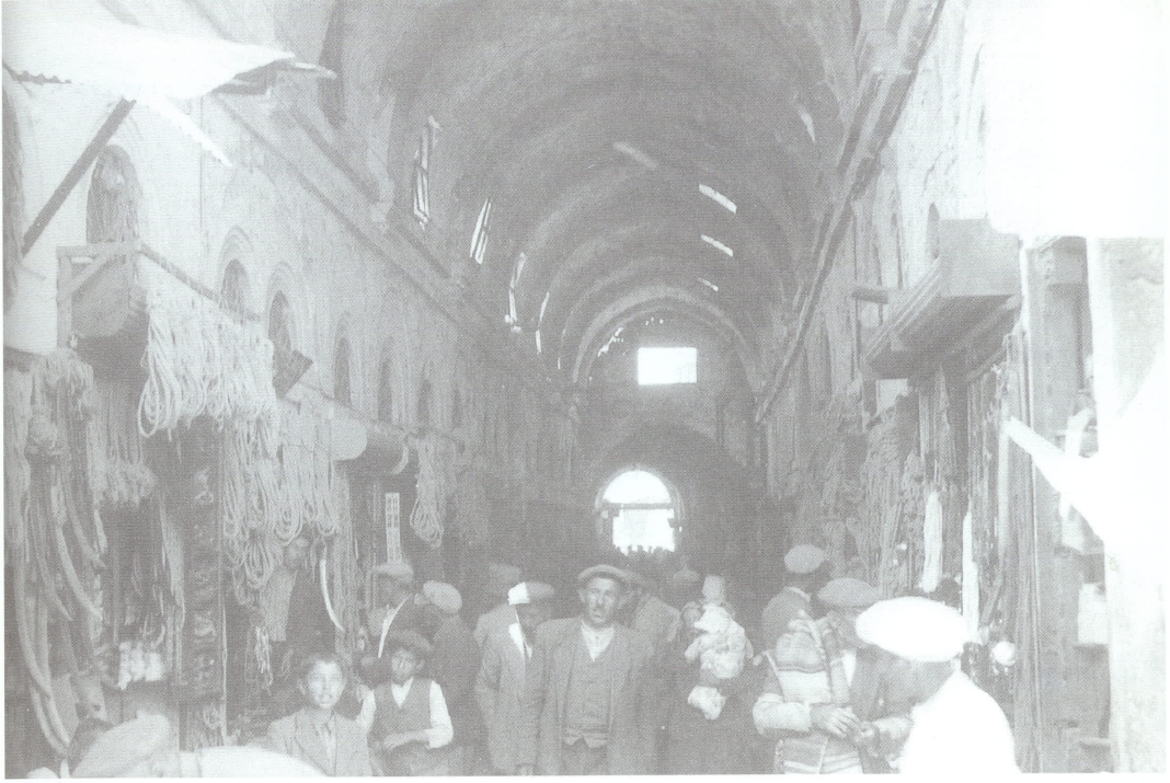
İçinde Attarlar Çarşısı'nın da bulunduğu Kapalı Çarşı'nın 1950'de çekilmiş bir fotoğrafı

Yukarıda bahsedilen bitkiler arasında yer verdiğimiz kitre, Kayseri'de tarih boyunca ekonomik yönüyle önem taşımıştır. 1835 yılında kente gelen William John Hamilton isimli bir gezgin gezi notlarında Kayseri'de kitre eldesinden de söz etmiştir. 1881 yılında kente gelen bir başka gezgin, Henry Fanshawe Tozer ise o dönemde özellikle Everek (Develi) civarındaki kadınların geçimlerini dağdan topladıkları "Keçi dikeni" denilen ve Latince adı Astragalus verus olan bitkiden elde ettikleri kitre zamkından sağladıklarını belirtmiştir. Yine gezginin notlarından Kayseri pazarlarında çok fazla miktarda satıldığını öğrendiğimiz kitre zamkı o dönemlerde daha çok ilaç hammaddesi olarak kullanılıyor ve genellikle de İngiltere'ye ihraç ediliyordu (71). Tozer, kitre zamkının nasıl elde edildiğini de gözlemlerine dayanarak kitabında anlatmıştır. Buna göre küçük çalı ya da ağaçların dalları kesilerek akıtılan sakız birkaç