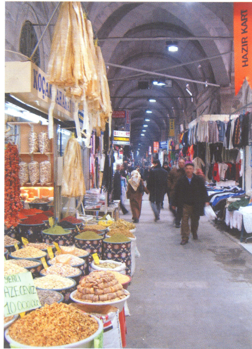
Tarihi Kayseri Kapalı Çarşısı içinde, eski Attârlar Çarşısı'nın bulunduğu yerdeki bir aktar