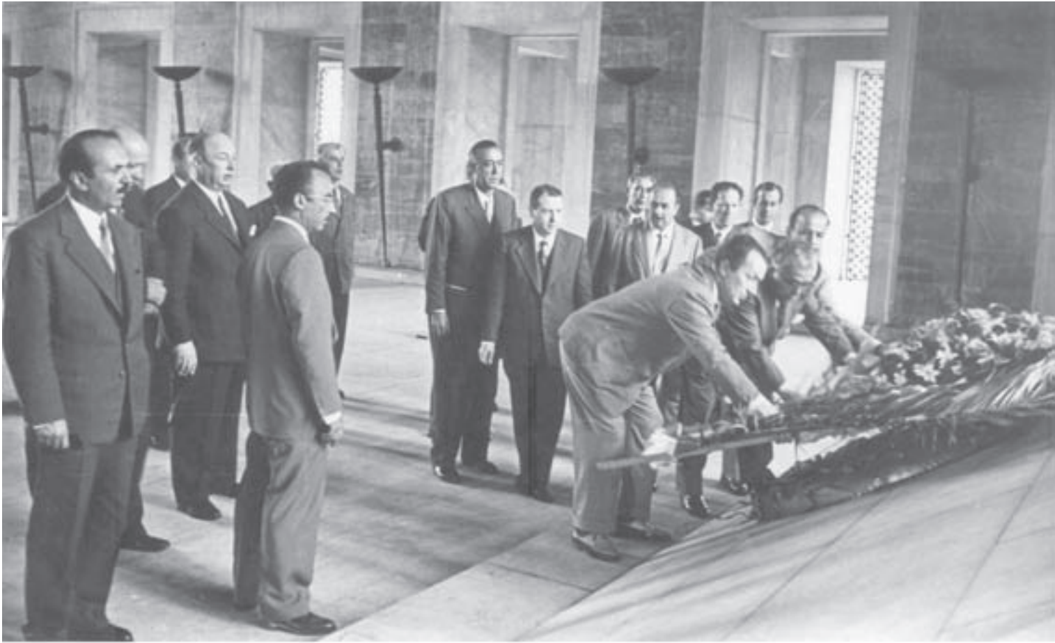
21-22 Mayıs 1956 Kurucu Kongre Üyeleri Atanın Huzurunda