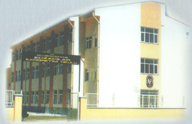
Türk Eczacıları Birliği İlköğretim Okulu DİYARBAKIR