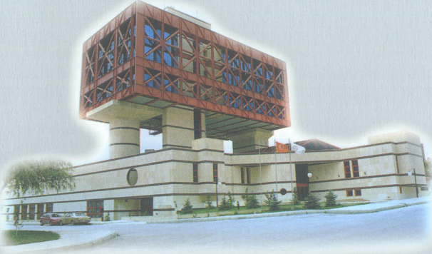
Türk Eczacıları Birliği Eczacılık Akademisi ve Sosyal-Kültürel Tesisleri ANKARA