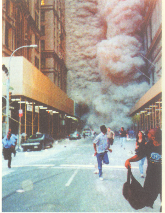
11 Eylül saldırılarının yarattığı hezeyan, toplumsal bellekte capcanlı duruyor.