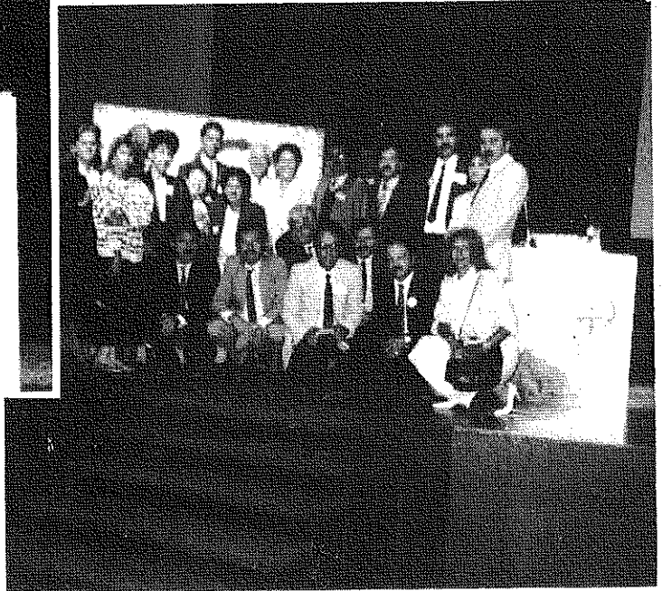
47. FIP Kongresine katılan Türk Heyeti