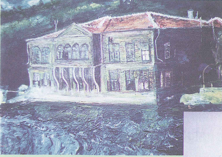
İstanbul (Bir yalı)