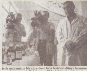
Irak makamları bir süre önce bazı tıbbi cihazları dünya basınına