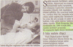
Sahte ilaçlar hastaları için ciddi bir tehliktir.

Türkiye sahte sağlıkçılar cenneti oldu. Sadece İstanbul'da bu yılın ilk altı ayında 13 sahte ilaç habiri ile 2 caha habiri yakalandı. Uzmanlar "Sağlığımızı tehlikeye atmayın" diyor