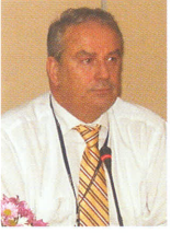
ECZ. MEHMET DOMAÇ (TEB Genel Başkanı)

Kurumlar bir yasayla, tek çatı altında birleşmediği için, yine kurumlara ayrı ayrı sözleşme yapılacaktır. Bu kurumlarda ilaç alımları birbirine benleştirilecek. Ucuz eşdeğer ilaç listesi uygulanacak. SSK'da olduğu gibi, çoğu kurumlarda 75 kalem ilaçta ucuz eşdeğer ilaç uygulaması olacak. Ucuz eşdeğer ilacın % 30'una kadar verilebilecek; bu, SSK örneğidir; tüm kurumlarda bu aynı olacak.