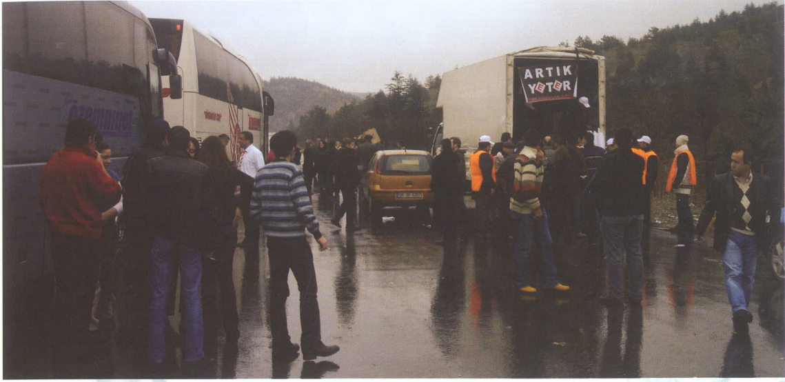
“Otobüslere kumanya ve önlük dağıtımı yapıldı”