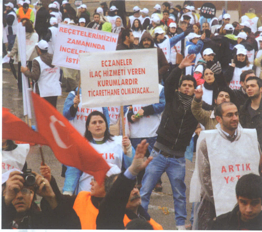
"Meydanlar doldu taşı"

"meşum gecede" Günübürlük tedavi diye bir şey aklına geldi birisinin.