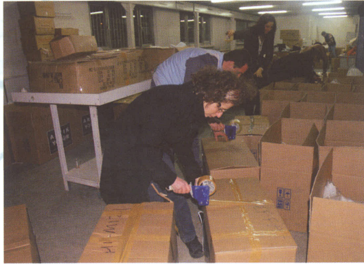
“Mitingden bir gece önce son hazırlıklar tamamlandı”