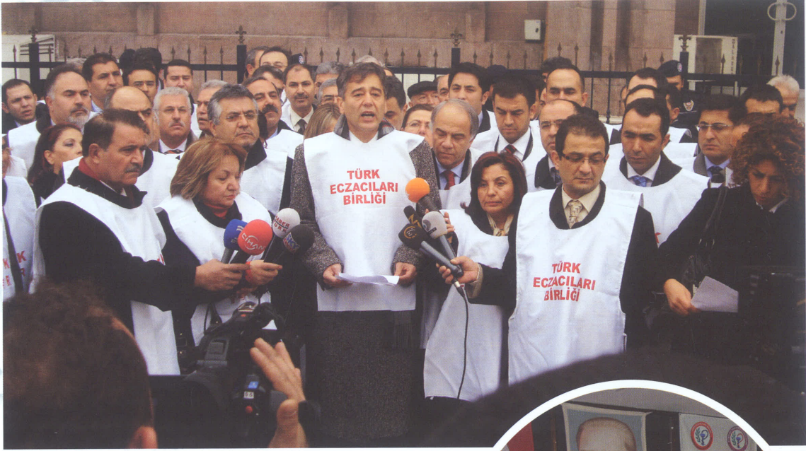
"Sağlık Bakanlığı önünde yapılan basın Açıklaması"