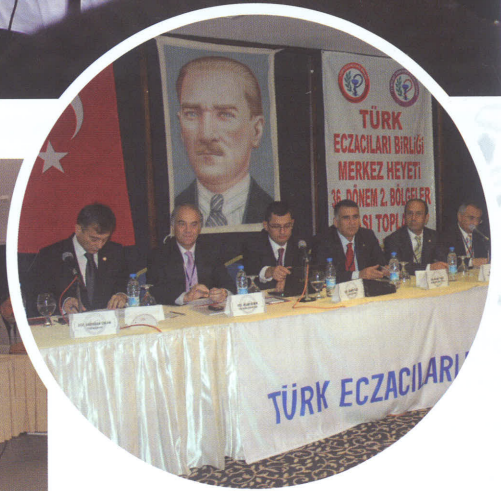
"Şanlıurfa Bölgelerarası Toplantı"

Eczacılar ilk kez 2001 yılının haziran ayında toplanmışlardı yine Ankara'da. Yıllarca seslerini bile çıkarmadan emeklerini, hizmetlerini, yüreklerini ortaya koymuşlardı... Hastalarına en iyi hizmeti verebilmek için... Yine hastaları için, sağlık sistemindeki çarpıklıkların düzeltilmesi için, her türlü yolu denemelerine rağmen çözüm bulamadıkları için; eczacılara verdikleri desteği hiçbir zaman esirgemeyen vatandaşlarına dertlerini anlatmak için yürüdüler karda, kışta, soğukta.