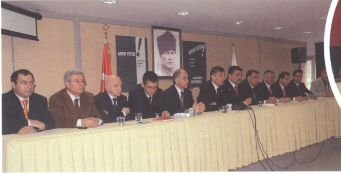
"Sorunlar İlk kez basın ile paylaşıldı."