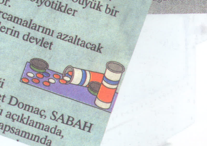
Türk Eczacıları Birliği Genel Başkanı Mehmet Domaç, SABAH gazetesinde yaptığı açıklamada, eczacılık etiği kapsamında...

TÜRK Eczacıları Birliği'nin topladığı veriler Türkiye'de bir yılda tüketilen 960 milyon kutu ilacın yüzde 8.3'ünün Başkentlilerce kullanıldığını ortaya çıkardı. Bu rakama göre, Başkentliler yılda 80 milyon kutu ilaç kullanıyorlar. Bu rakamın yüzde 20'si büyük bir oranda antibiyotiklerdir. İlaç harcamalarını azaltacak önlemlerin devlet tarafından alınması gerekiyor.