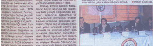
Türk Eczacıları Birliği Genel Başkanı Mehmet Domaç, eczacılık etiğinde, gizlilik, doğruluk, dürüstlük ve hasta haklarının ön planda olduğunu söyledi.

Başkanı Domaç: “Sağlıktan ve demokrasiden tasarruf olmaz”