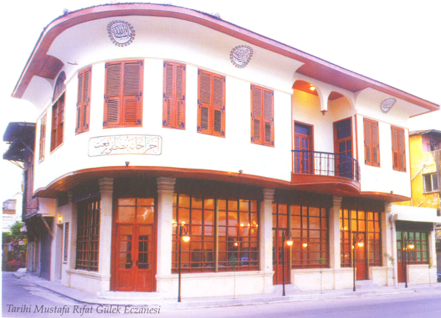
Tarihi Mustafa Rifat Gülek Eczanesi