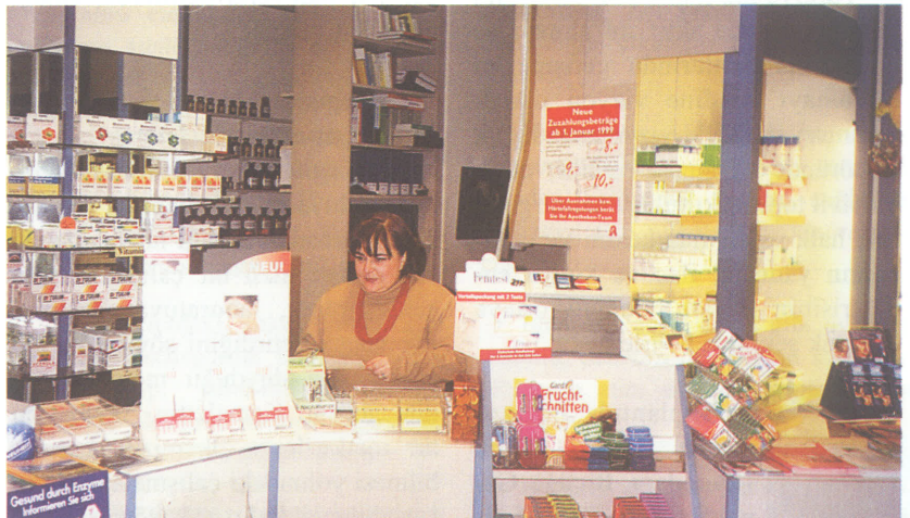
Almanya'nın Münih Kentinde yaptığımız eczane ziyaretlerinden birinde...

Sistemin farklılığı, kurumların birbirine öngörüsü çok farklı olduğundan gerçekleştirilemez gibi düşünülse de, bire bir uygulaması şu anda olamaz gibi görünse de, yakın bir tarihte ülkemizde de böylesi bir sistemi hayata geçirmenin çabası içinde olmamız gerektiğine inanıyorum."