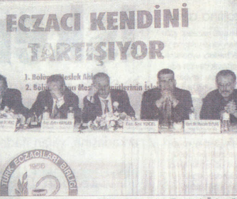
Eczacılar, onları suça iten sistemin tartışılması gerektiğine dikkat çekti.