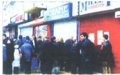
Daha önce de yurt genelinde kepenk kapatma eylemi yapan eczacılar yeşil kart alacakları için 27 Mayıs'ta miting yapmaya hazırlanıyor.