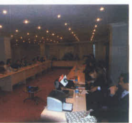
ÖĞRENCİ PLATFORMU 2007 SONUÇ BİLDİRİSİ

Farmavizyon kapsamında gerçekleştirilen Farmavizyon Öğrenci Platformu'nda TEB'nin 12 eczacı fakültesiyle 20 öğrenci, bir hafta süreyle katıldıkları toplantıda, 6197 sayılı kanunla hazırlanan 14 Mayıs Eczacılık Günü'nün kutlanacağına ilişkin kararları görüşüyorlar. Toplantıda, 6197 sayılı kanunla hazırlanan 14 Mayıs Eczacılık Günü'nün kutlanacağına ilişkin kararları görüşüyorlar. Toplantıda, 6197 sayılı kanunla hazırlanan 14 Mayıs Eczacılık Günü'nün kutlanacağına ilişkin kararları görüşüyorlar.