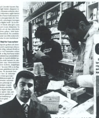
Alkollü kartta parmak izi devri. Sağlık Bakanlığı'nın başlatmış olduğu elektronik reçete sistemi, eczacıların işlerini kolaylaştırıyor.

Elektronik reçete sistemi ile doktor yazısını 'çözme' devri sona eriyor. Sağlık Bakanlığı'nın başlatmış olduğu elektronik reçete sistemi, eczacıların işlerini kolaylaştırıyor. Doktorların yazdığı reçetelerin elektronik ortamda eczanelere iletilmesi, eczacıların reçeteleri daha hızlı ve doğru şekilde okuyabilmesini sağlıyor. Bu sistem, eczacıların reçeteleri daha hızlı ve doğru şekilde okuyabilmesini sağlıyor. Bu sistem, eczacıların reçeteleri daha hızlı ve doğru şekilde okuyabilmesini sağlıyor.