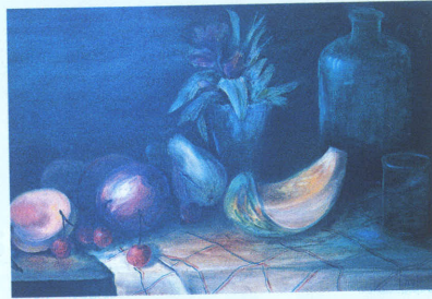
Meyveli natürmort. 50x70 Tual üzerine yağlıboya