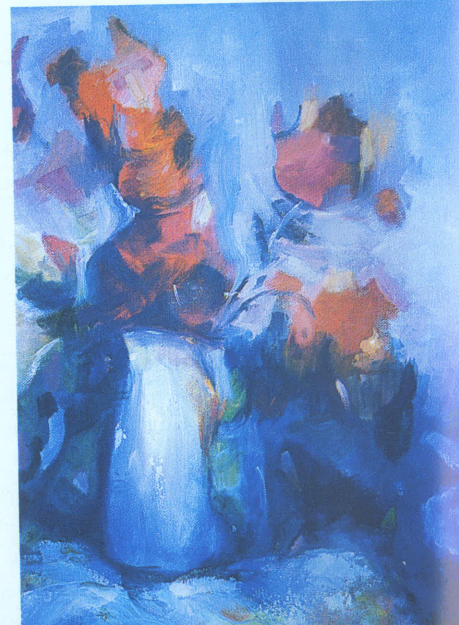
Kırmızı çiçekler. 40x50 Tual üzerine yağlıboya