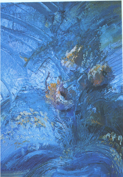
Tomurcuklar. 30x40 Tual üzerine yağlıboya