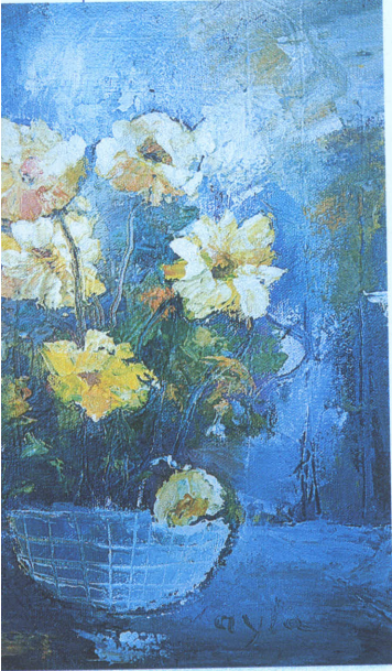
Sarı Çiçekler. 40x30 Tual üzerine yağlıboya