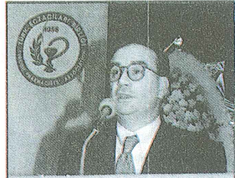
Türk Eczacıları Birliği Başkanı Ecz. Mehmet DOMAÇ