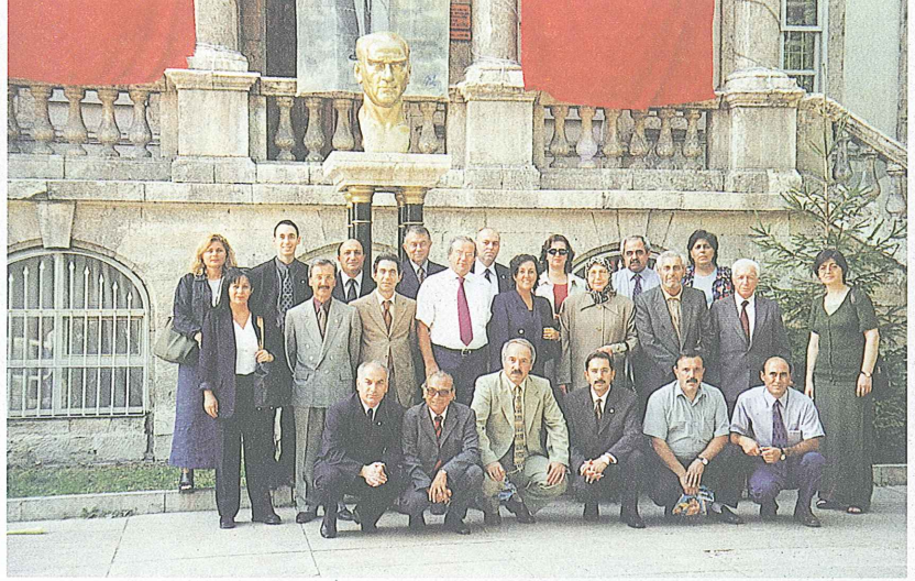
Sivas-Atatürk Kongre ve Etnografya Müzesi'nin önü.

Türk Eczacıları Birliği Merkez Heyeti Sivas Kongresi'nin 81.yıldönümünde olağan toplantısını Sivas'ta gerçekleştirdi.