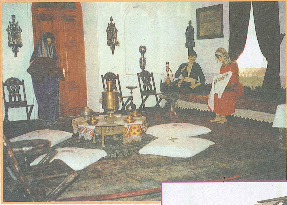
Latifağa Konağı- Tokat