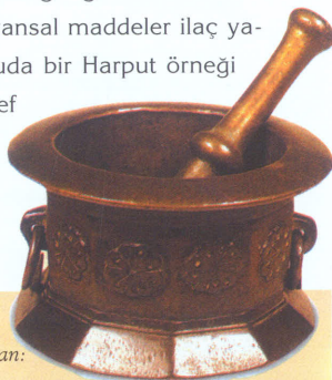
Eczacılık Müzesi'nin kurucusu olan Prof.Baytop'un koleksiyonundan: Tunc Sölcüklü Havanı

"...Bütün Anadolu'da olduğu gibi bir zamanlar Harpüt'ta da bitkisel ve hayvansal maddeler ilaç ya- pımında kullanılırdı. Bu konuda bir Harput örneği vermek için Elazığlı şair Şeref Tan'ın "İlaç tarifleri" adlı şiiri aynen aşağıya alınmıştır: