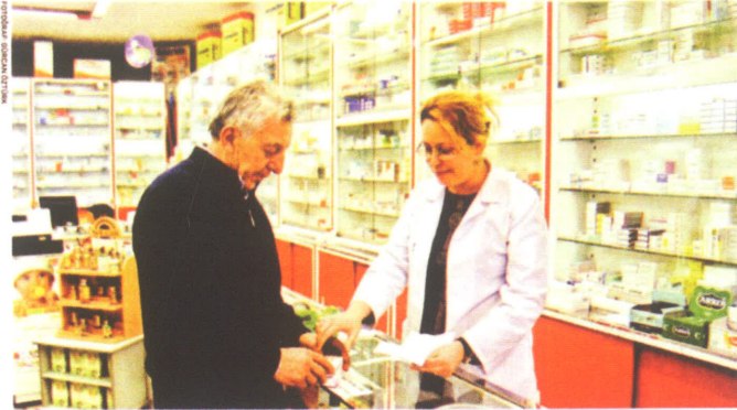
Sağlık karnesiyle eczanelerden ilaç alınmasını düzenleyen protokol için uzlaşmaya varıldı. Protokol bugünden itibaren geçerli olacak.