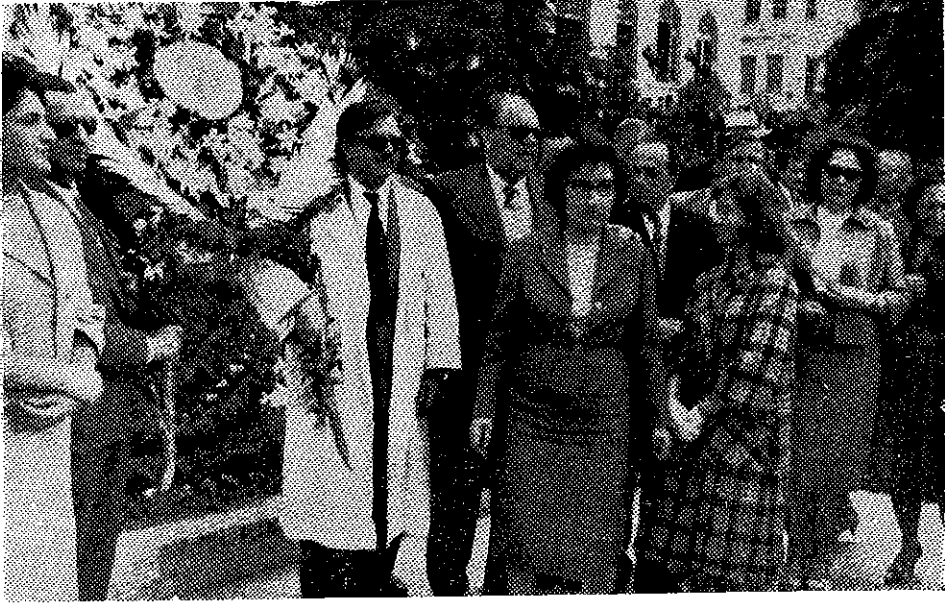
27 Mayıs İnkilabını müteakip Bursada yapılan Büyük Mitinge mahalli Eczacı Odası adına iştirak eden meslektaşlar: Atatürk Anıtı önünde