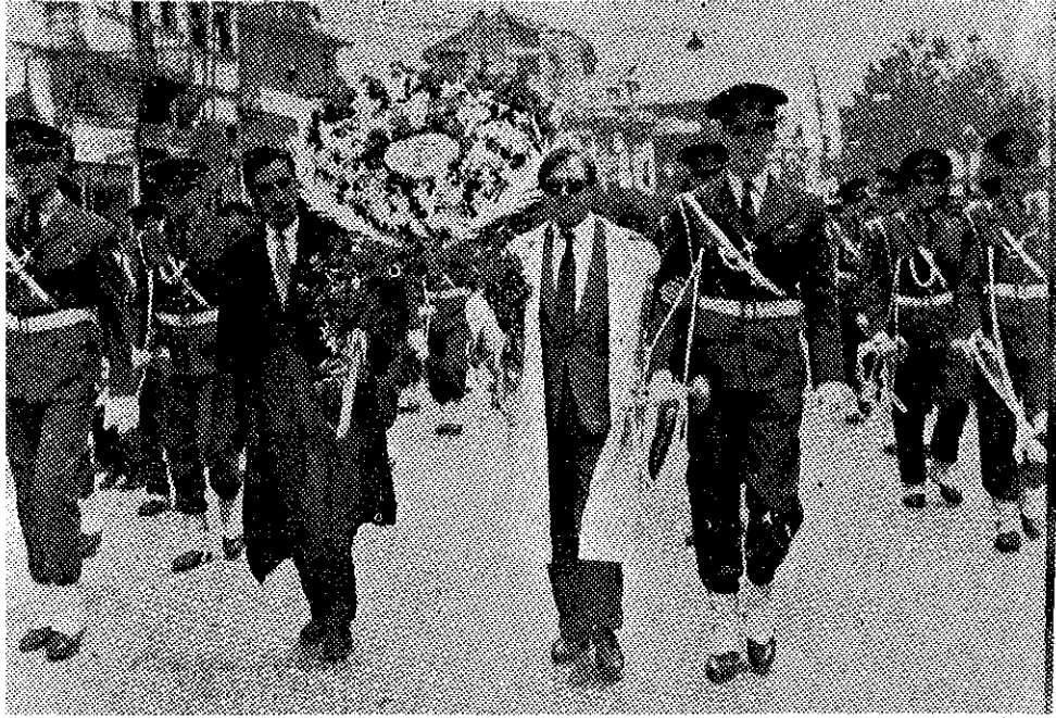
7 Mayıs İnkilabını müteakip Bursada yapılan Büyük Mitinge mahalli Eczacı Odası adına iştirak eden meslektaşlar: Merasim yürüyüşünde