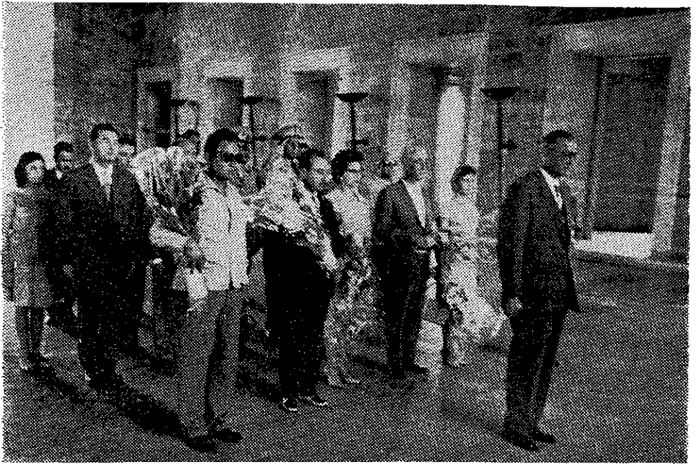
Türk Eczacıları Ölmez Ata'nın manevî huzurunda.