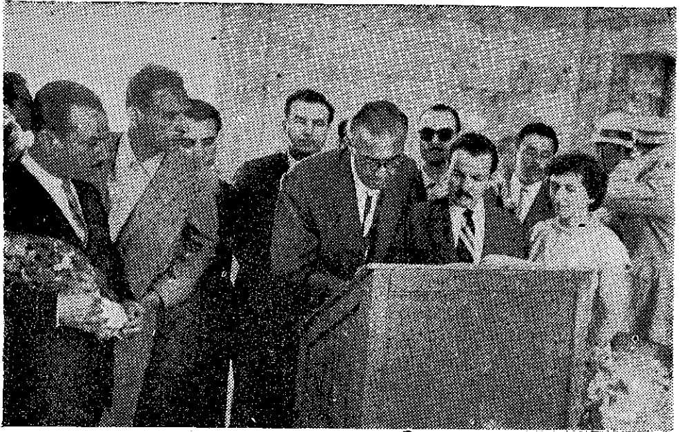
Anıt Kabirde Meslektaşlarımızın hissiyatına tercüman olarak defteri mahsus imzalanırken: